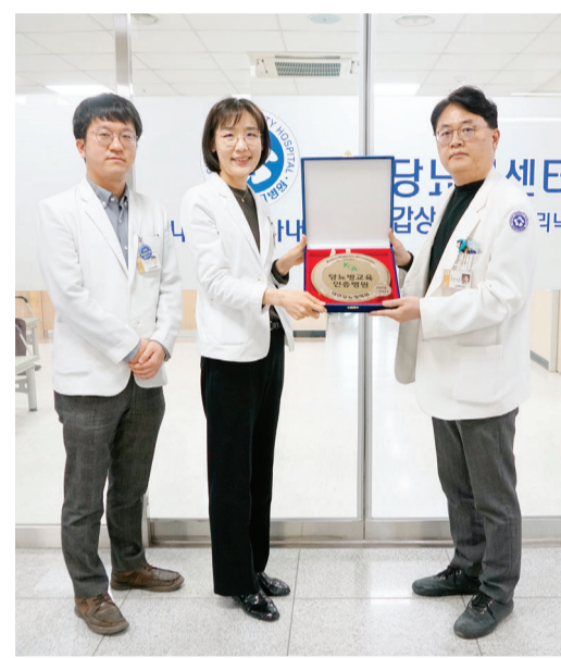
진에 최선을 다하겠다”고 말했다.