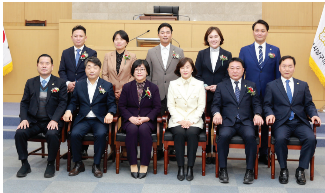
광주시 남구의회는 최근 의회 개원 28주년을 맞아 전·현직 의원 및 주민 130여명과 함께 기념행사를 개최했다. 이날 행사에서는 지역 사회 및 의정 발전에 공헌한 유공자에게 감사패와 표창패를 수여했다.