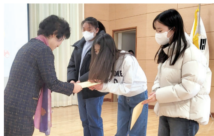
보성여중에서 열린 2023학년도 입학식에서 이 학교 출신 네자매의 장학금이 전달됐다.

보성여중은 1960년 문을 열어 지난 2022년까지 1만여명의 인재를 배출했다. 올해는 독서토론 글쓰기 교육 활성화를 위해 ‘독서 통장제’와 함께 걷는 학교 공동체를 주제로 ‘민주시민 학교’를 운영한