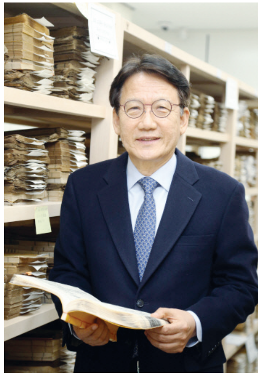
지난해에는 호남학을 매개로 다양한 분야의 전문가들이 연구 내용을 공유하는 콜로키움을 문화기관들과 함께 운영해 주목을 받았다. 또한 유튜브 형식의 호남학TV는 다양한 콘텐츠를 손쉽게 접할 수 있

지역민과 함께 호남학을 공유하기 위한 실질적인 방안 마련도 중요하다. 호남과 연관된 도서 출판, 열린 강좌, 저술출판 지원 등이 그것. 특히 호남학의 의미있고 흥미로운 분야를 발굴해 홈페이지에 게재하고 있는 ‘호남학 산책’은 인기 코너다. 각계 전문가들로 꾸려진 편집진이 ‘명시 초대석’, ‘풍경의 기억’, ‘고문서와 옛편지’, ‘맛 기행’ 등을 주제로 글을 올리고 독자들에게 메일링서비스된다.