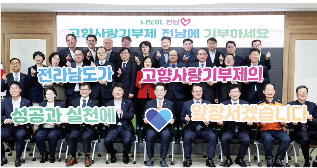
김영록 전남지사 등 전남도 실국장 이상 공무원들이 7일 도청 서재발실에서 고향사랑기부제 성공 안착을 위한 응원 메시지를 전달했다.