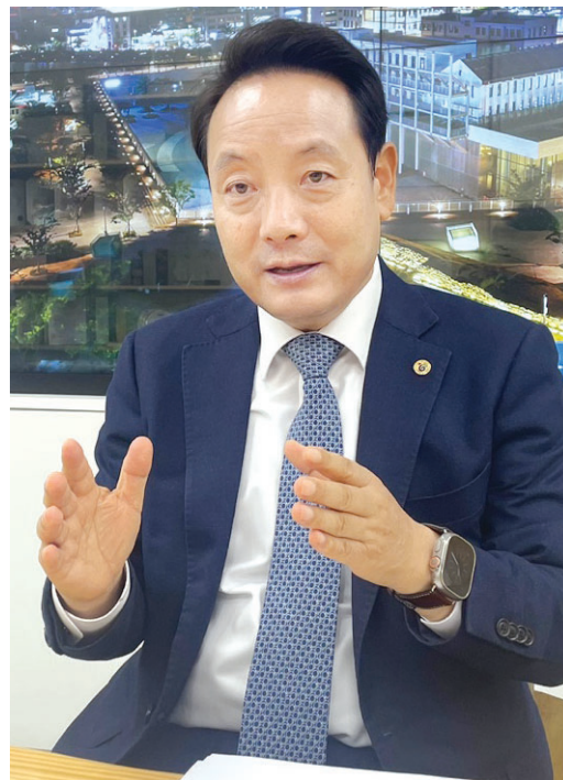
육·교육 환경을 개선한 것이 학부모들을 끌어들이었다고 분석했다. 이어 “올해 내남동 구립도서관, 계림동 청소년문화의집을 개관하고 내년까지 청소년 상상플러스센터를 완공하는 등 교육 인프라 확충에 박차를 가하겠다”고 덧붙였다. 청년들이 창업하기 좋은 환경을 만들었다는 점도

임 정장은 또 “도시재생사업을 통해 사회문화적 정주 여건을 개선해 온 것도 좋은 성과를 냈다”며 “특히 미로센터, 인문학당 등 문화시설을 확충하고 장난감 도서관, 육아종합지원센터 등을 설치해 보