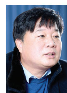
연구 내부부는 불안정한 혈관 형성으로 인해 약물 침투가 어렵고 높은 활성산소 농도를 유지한다.

고행암의 치료는 일반적으로 외과적 수술, 항암 약물 요법, 방사선 치료 등이 주로 사용되지만 여전히 높은 재발율에 사망으로 이어지고 있다. 특히 고