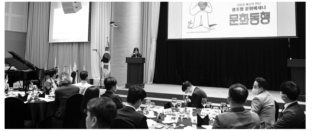
지난해 열린 광주문화재단의 '문화동행' 행사 장면.