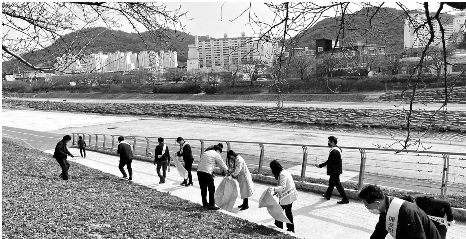
정읍시, 봄맞이 환경 정화활동 정읍시가 새봄을 맞아 깨끗하고 쾌적한 생활환경 조성을 위해 오는 31일까지 새봄맞이 일제 대청소 기간으로 정하고 시민과 유관기관, 공무원이 함께하는 환경정화 캠페인을 펼치고 있다. 정읍천 주변 등에 쌓여있던 각종 쓰레기와 도로변 등에 방치되어 있던 불법투기 쓰레기를 대대적으로 수거해 시민들에게 쾌적한 생활환경을 제공한다는 계획이다.