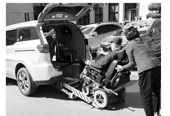
정읍시 관계자가 증증장애인에게 이동 지원 서비스를 하고 있다. 승자의 안전을 위해 차량 내부에 고정 벨트와 안전바 등이 설치돼 있다. 차량 이용을 희망하는 증증장애인은 전북지체장애인협회 정읍시지회로 문의하면 된다. /정읍=박기섭 기자-전북취재본부장 parkks@

정읍시가 전북 지역 최초로 홀몸 증증장애인의 이동권 보장을 위해 '독거 증증장애인 이동 지원사업'을 추진한다. 독거 증증장애인 이동 지원사업은 보호자가 없는 증증장애인이 장애인콜택시를 이용할 수 없는 경우 차량 기사와 도우미가 현장을 방문해 차량 이용을 도와주는 사업이다. 신체적·정신적 장애 등으로 거동이 불편해 혼자서 일상생활과 사회생활을 하기 어려운 장애인의 삶의 질 향상과 이동권 보장을 위해 추진된다. 사업은 전북지체장애인협회 정읍시지회가 정읍시로부터 총사업비 10억9000만원을 지원받아 위탁 운영한다. 증증장애인 이동 지원사업에는 지역 내 교통약자 910명이 등록되어 있으며, 지난 1월부터 현재까지 일일 평균 차량 1대당 12명이 이용하고 있다. 차량은 총 18대로 모든 차량에는 휠체어가 탑승할 수 있도록 휠체어 리프트가 마련돼 있으며, 탑