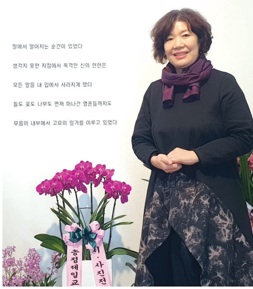
말에서 멀어지는 순간에 영매다 생각지 못한 지점에서 목적인 신의 현현은 모든 말을 내 앞에서 사라지게 했다 동도 빛도 나무도 언제 떠나간 영혼들까지도 무명의 내부에서 고통의 열거를 이루고 있었다

멸의 순환이 담긴 풍경을 토대로 생의 숭고함과 ‘지금’이라는 시간의 소중함을 보여주고자 했다는 말에서 작품의 지향점이 읽혔다.