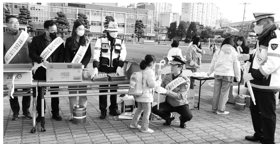
장흥경찰서는 지난 16일 등교시간에 맞춰 장흥초등학교 앞에서 어린이 교통안전 캠페인을 실시했다. 이날 캠페인은 장흥경찰서를 비롯해 장흥군, 교육청, 장흥초, 청소년 상담복지센터 등 70여명이 참여한 가운데 진행됐다.