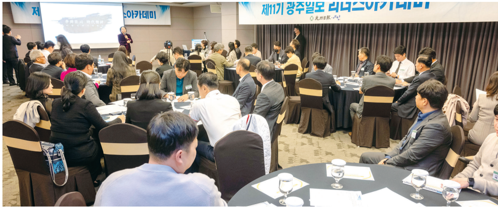
영화 '명량'으로 역대 한국영화 사상 최다 관객을 동원한 김한민 감독이 지난 21일 오후 광주시 서구 치평동 라마다플라자 광주호텔에서 열린 '광주일보 11기 리더스아카데미' 1학기 첫 강사로 나서 '이순신과 시대정신'을 주제로 이야기하고 있다.

호텔에서 열린 '광주일보 11기 리더스아카데미' 1학기 첫 강연에 나선 김한민(사진) 감독은 최근 일본에서 개봉한 '한산: 용의 출현' 일본어 해설 예고편을 보여주고 난 뒤 입을 뗐다.