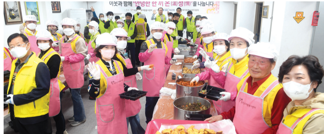
23일 오전 광주 남구 월산동 남구자원봉사센터 작업장에서 남구자원봉사센터 봉사자들이 지역 어르신들에게 전달할 도시락을 만들며 환하게 미소짓고 있다.