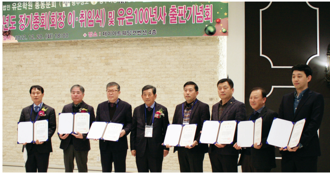
유은학원 100년사 발간 출판 기념식이 지난해 12월 20일 총동문회 회장 이취임식과 함께 열렸다.