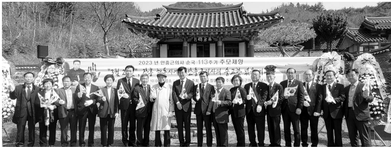
장흥 해동사 '안중근 의사 순국 113주기 추모제' 김성 장흥군수와 왕윤채 장흥군의회 의장, 지역 기관단체, 죽산 안씨 문중 관계자 등 500여명이 참석한 가운데 26일 장흥면 해동사에서 '안중근 의사 순국 113주기 추모제'를 봉행했다. 전통제례로 시작한 추모제는 악사보고, 유언 낭독, 추모 공연, 헌화 분향의 순으로 진행됐다. 해동사는 전국에서 유일하게 안중근 의사를 모신 사당이다.