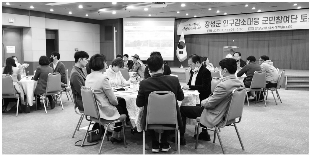
'장성군 인구감소대응 군민참여단 토론회'가 최근 장성군청 아카데미홀에서 열렸다.

학령기 가족의 지역 만족도가 높지 않지만 이러한 흐름이 중·고교 진학 이후까지 이어질 수 있고