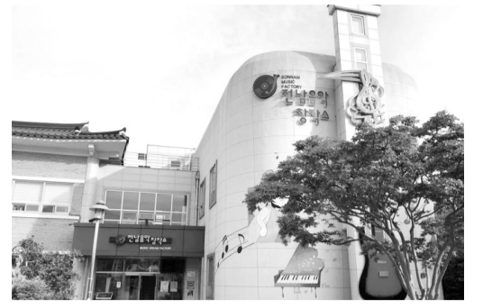
전남 음악 창작소.

음악과 공연이 넘치는 '음악도시 강진'을 조성해 음악·예술 관련 '관계인구' 유입 및 대규모 관광객 유치에도 나설 방침이다.