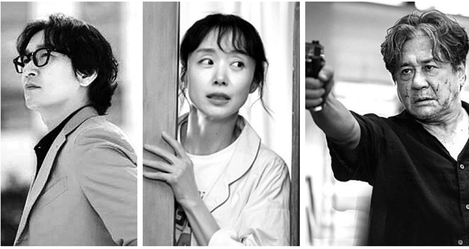
'신성한 이혼' 조승우