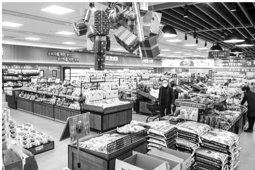
첨단 장성로컬푸드직매장에는 2800가지가 넘는 신선한 농산물이 판매되고 있다.

장성을 대표하는 농산물은 여러 가지다. 그 중 다섯손가락 안에 꼽히는 품목이 제철과일이다. 지난 겨울부터는 딸기가 불타나게 팔려나갔다. 겨울 딸기가 지나면 여름에는 일명 '딱딱이'라고 불리는 자물 복숭아와 캠벨포도, 샤인머스켓이, 가을에는