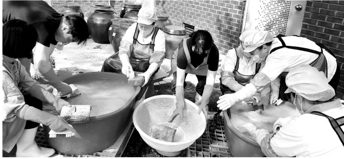
문화를 이어가고, 바른 먹거리를 제공하는 뜻깊은 시간이 됐다”며 “학생들이 참여하는 체험행사를 꾸준히