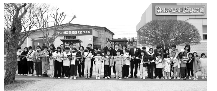
신안군압해읍압해동초등학교에 방과 후 어린이를 대신 돌봐주는 '학교돌봄터'가 전남에서 처음으로 개소했다. <사진> 학교돌봄터는 압해동초에 130㎡로 조성됐다.

신안군압해읍압해동초등학교에 방과 후 어린이를 대신 돌봐주는 '학교돌봄터'가 전남에서 처음으로 개소했다. 군은 지난 28일 압해동초교에서 학교돌봄터 1호 개소식을 열었다. <사진> 학교돌봄터는 압해동초에 130㎡로 조성됐다. 학기 중에는 방과 후부터 오후 8시까지 돌봄을 받을 수 있다. 방학 중에는 오전 9시부터 오후 8시까지 학교돌봄터를 운영한다. 이 공간은 학생 수요에 따라 탄력적으로 운영 시간을 조정할 계획이다. 학교돌봄터는 방과 후에 어린이를 돌보기 어려