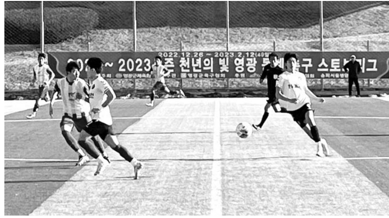
영광군이 올해 13개의 전국 규모 체육대회를 치르며 2024년 전남체전 성공 개최를 준비한다. 지난달 막을 내린 2023년의 빛 영광 동계 축구 스토브리그 경기 모습(왼쪽)과 이달 18~19일 영광에서 열린 '제9회 현정화 배 탁구 대회' 경기.

8일), 전국 대학 태권도대회(12~15일) ▲12월 전국 당구대회(17~25일) 등이 있다. 도 규모는 이달 9일 치른 전국소년체전 축구 전남예선을 시작으로 17개 대회가 개최된다. 영광군은 내년 열리는 제63회 전남체전과 32회 전남 장애인체전을 유치했다. 내년 4월 개최하는 전남체전에는 22개 종목 2만명(장애인체전 21개 종목·1만5000명)이 참가해 경합을 벌인다. 영광군은 코로나19 거리두기 완화에 따라 체육기반시설을 확충하고 개선하며 전국 규모 대회 유치에 공을 들여왔다. 지난 22일에는 영광 실내수영장 다목적실에서 지역 숙박업소 대표자와 간담회를 열어 2024년 전남체전의 성공적인 개최를 다짐했다. 숙박업중앙회 영광군지부는 이날 간담회에서 대회 기간 선수단에 우선 예약을 협조하고 부당요금