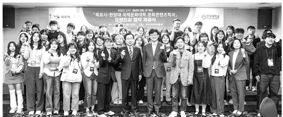
박홍률 목포시장과 한양대 국제문화대학 문화콘텐츠학과 관계자들이 관광 콘텐츠 발굴과 관광 활성화를 위한 협약을 맺고 기념촬영을 하고 있다.

목포시가 한양대 국제문화대학과 관광콘텐츠 개발에 나선다. 목포시는 지난 29일 목포 상그리아 호텔에서 한양대 국제문화대학 문화콘텐츠학과와 관광 콘텐츠 발굴과 관광 활성화를 위한 협약을 맺었다고 밝혔다. 양측은 상호 협력 증진을 위한 진선 교류, 목포 관광·문화 자원 콘텐츠 개발 및 홍보 강화 등의 사업을 한다. 한양대는 협약을 시작으로 3박 4일 동안 목포의 주요 명소부터 숨겨진 명소 구성구석을 살펴본다. 20~30대 MZ세대 시점에서 목포를 탐방하면서 목포만의 관광자원을 확인하게 된다. 30일에는 미식문화갤러리-해관1897에서 해관의 역사를 확인하고 MZ세대와 함께하는 '목포의 맛' 토코쇼와 음식을 시식을 진행했다. 한양대 국제문화대학은 이번 답사를 통해 목포에 대한 청년층의 관심과 방문, 체류까지 유도할 수 있는 콘텐츠 아이디어를 제시하고 시는 이를 적극 수