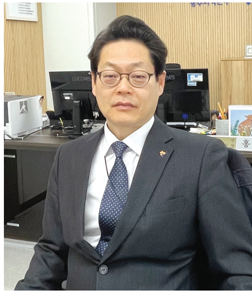
차가 많이 벌어진 상태에 주목했다.

홍 본부장은 지난 2021년 장애인경제활용실태조사에서 중증 실업률은 7%, 고용률은 19.9%로 중증장애인의 실업률 5.6%, 고용률 41.7%에 비해 격