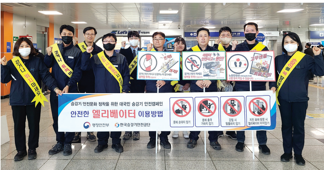
한국철도(코레일) 광주전남본부는 최근 대중교통 마스크 착용 의무 해제 및 봄 날들이철 관광객 증가에 따라 광주 승정역에서 중대시민재해 예방을 위한 승강기 올라로 타기 안전캠페인을 시행했다.