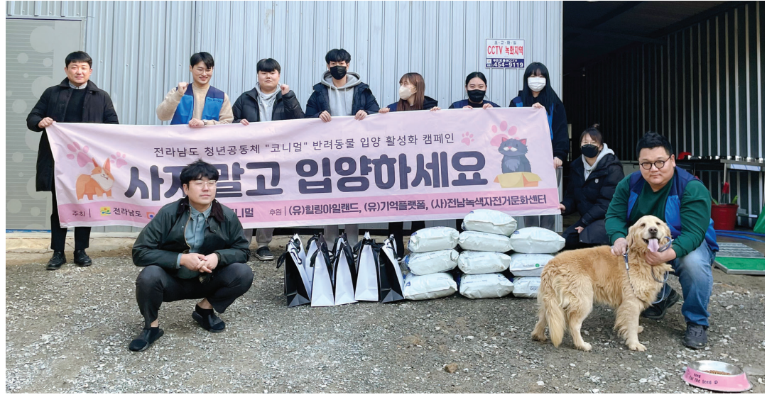
무안지역 청년 7명이 의기투합해 만든 공동체 ‘코니멀’이 지난달 무안군 유기동물보호소를 찾아 유기동물을 위한 사료와 물품을 전달하고 유기동물 입양 활성화를 위한 홍보를 하고 있다.

코니멀은 유기견 입양 문화를 정착시키자며 제정된 ‘국제 강아지의 날’(3월23일)에 유기동물에 관한 관심을 높이고자 인스타그램 캠페인을 벌이기도