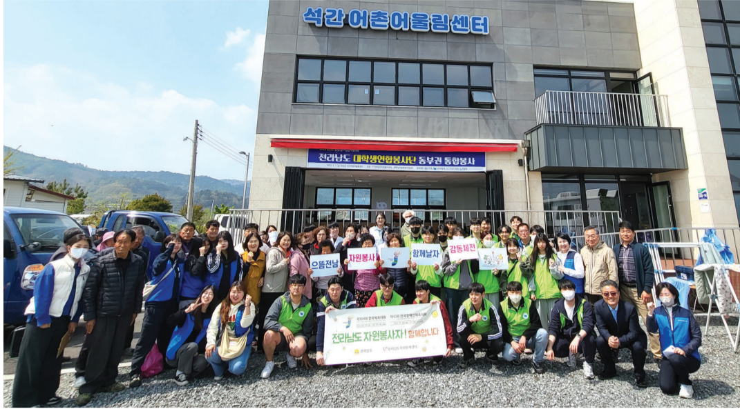
지난 7일 전남어촌특화지원센터와 전남자원봉사센터가 공동 주최한 재능기부 봉사에 참여한 대학생들이 석간 어촌어울림센터에서 포즈를 취했다.

라남도자원봉사센터에서 발족한 봉사단체다. 전남자원봉사센터와 지난 3월 10일 전남어촌특화지원센터와 업무협약을 체결하고 어촌에서의 정기적인 자원 봉사 활동에 나서기로 했다. 이날 대학생들은 주민들을 대상으로 자신의 전공인 복지·기술·의료 분야의 맞춤형 봉사활동을 벌였다. 순천대는 현장에서 직접 컵케이크를 만들어 제공하고, 순천제일대는 집집마다 찾아가 가스안전차단기를 설치하고 점검했다. 전남도립대는 열색·네일 서비스와 함께 드론을 활용해 마을 전체를 항공 촬영했으며, 청암대는 시력검사 및 돋보기를 제공해 어르신들의 만족을 이끌어냈다. 또 참여 대학생들은 전남어촌특화지원센터와 함께 보성 석간 앞바다에서 2시간 동안 해변의 쓰레기를 줍는 ‘바다가꿈’도 함께 했다. 보성 석간 어촌계는 바다를 깨끗이 관리하며 어촌의 지속가능성을