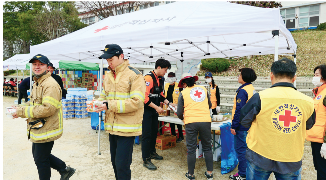
대한적십자사 광주전남지사는 지난 3일 산불 피해가 발생한 합평군 신광면, 순천시 송광면 등 지역주민들을 대상으로 구호물품 지원 재난심리지원 활동 등을 펼쳤다.