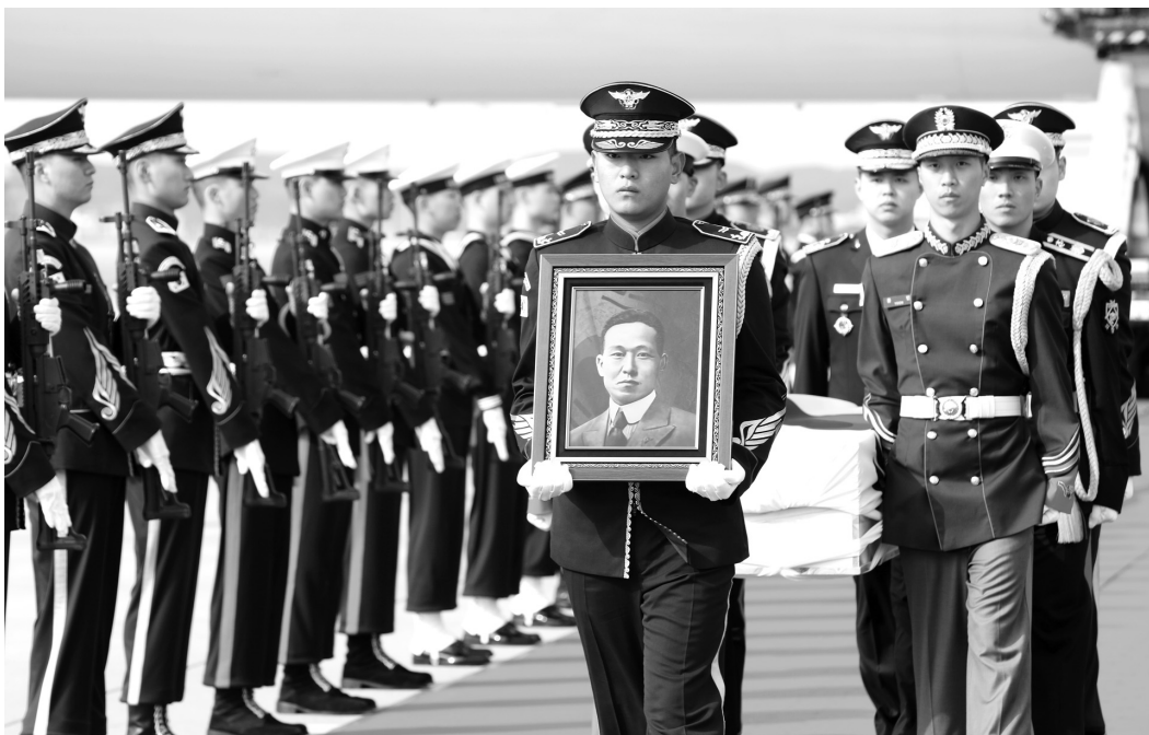
10일 인천국제공항 제2터미널 주기장에서 열린 황기환 애국지사 유해 영접 행사에서 국방부 의장대가 유해를 봉송하고 있다.

1886년 4월 4일 평남 순천에서 태어난 선생은 19세가 되던 1904년 증기선을 타고 미국 하와이 호놀룰루에 입항했다. 제1차 세계대전이 터지자 1918년 5월 18일 미군에 자원입대해 참전했다. 종전 후 유럽에 남은 선생은 1919년 6월 파리로 이동해 프랑스 베르사유에서 개최되는 평화회의에