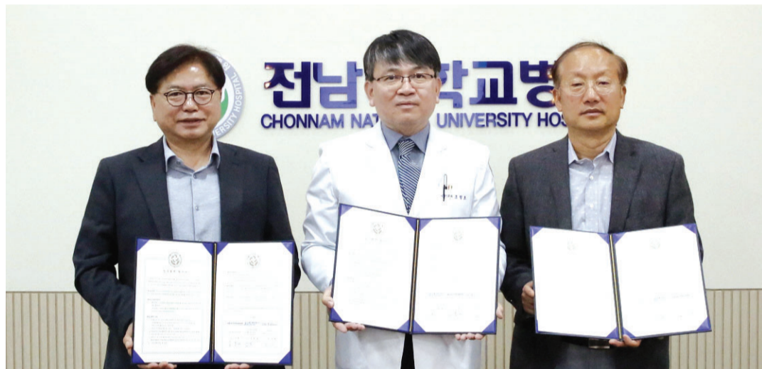
전남대 생체의료시험연구센터가 전남대병원, 한국광산업진흥회와 함께 광주 주력산업 업무협약을 체결했다.