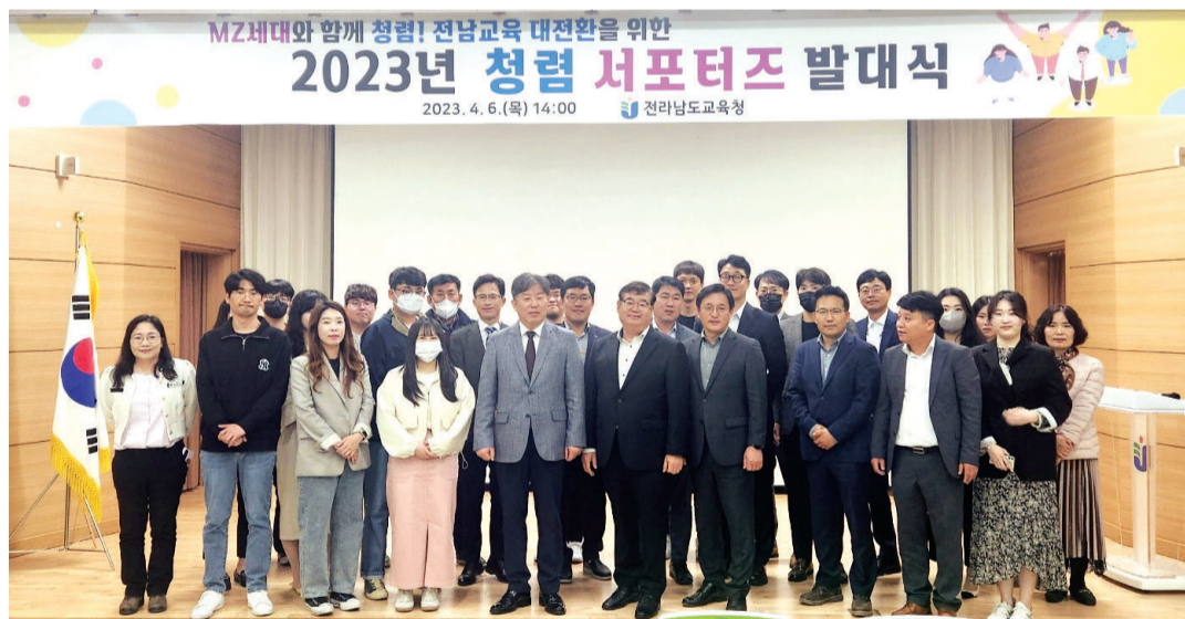
교직원 대상 공모를 통해 선정된 청렴과제연구단과 새내기 청렴홍보단 등 총 28명으로 구성된 전남도교육청 '청렴 서포터즈'가 최근 발대식을 갖고 청렴문화 확산에 나섰다.