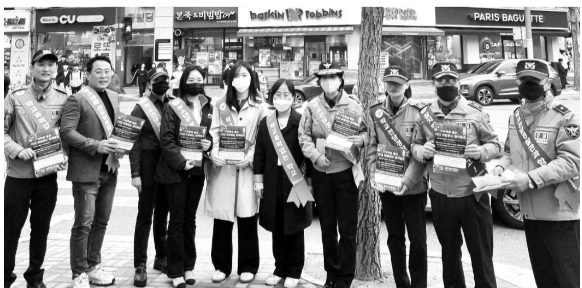
광주남부경찰서는 최근 남구 봉선동 학원가 밀집지역인 쌍용4거리 일대에서 학생과 학부모에게 마약 음료수·캔디 주의 내용을 담은 홍보 전단지 제작 배포했다.