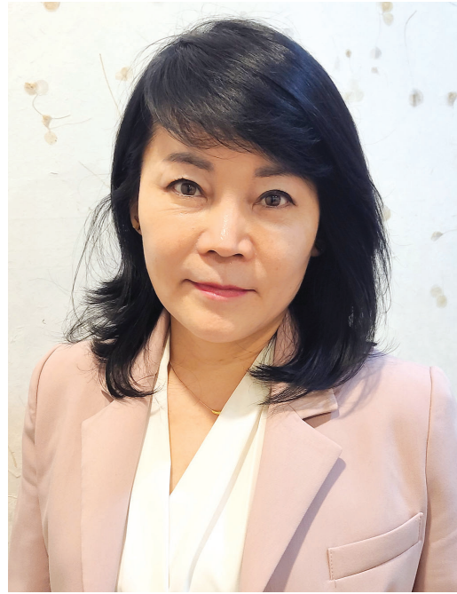
롯데 기초수급대상자 집 고쳐주기 봉사활동, 독거 노인 방문 미용봉사 등 활동도 펼쳐왔죠. 광주 출신으로 토박이인 그는 대학 졸업 후 잠시

대한어머니회 조직은 중앙회를 필두로 10개의 전국 연합회와 102개의 지회로 구성돼 있다. 모두 2만 3000여명의 회원들이 활동하고 있으며 그 가운데 광주연합회는 본부와 5개 지회로 구성돼 활동하고 있다. “지금까지 대한어머니회는 기후위기 환경 캠페인, 아동 다례교육, 청소년 업사이클링 체험교실을 운영했습니다. 이밖에 취약계층 소비자 교육을 비