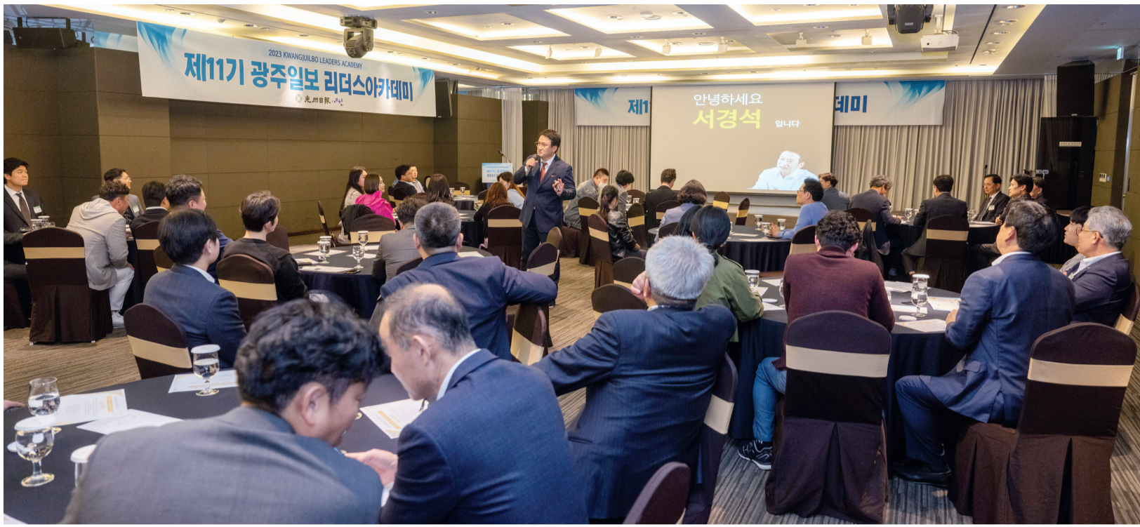
지난 11일 라마다플라자 광주호텔에서 열린 '제11기 광주일보 리더스아카데미'에서 방송인 서경석씨가 '작은 변화가 미래를 바꿀 수 있다'를 주제로 이야기를 하고 있다.

“안녕하세요. 서경석입니다.” 제11기 광주일보 리더스아카데미 강사가 지난 11일 광주시 서구 치평동 라마다플라자 광주호텔에서 열렸다. 이날 강연자로 나선 방송인 서경석씨는 사회자의 소개를 정중히 거절하고 원우들이 앉아있는 테이블을 오가며 재미있는 입담으로 자신을 소개해 나갔다.