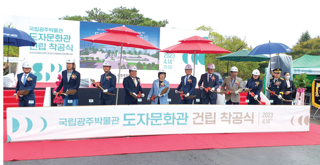
국립광주박물관은 2025년 개관 예정인 '국립광주박물관 도자문화관 건립' 착공식을 최근 개최했다.