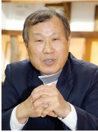
새로운 사실들을 밝혀냈다.

이를 계기로 한국 근·현대사를 제대로 공부하기 위해 1983년 한국학중앙연구원 부설 한국학대학원