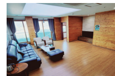
- VIP 4인실 -