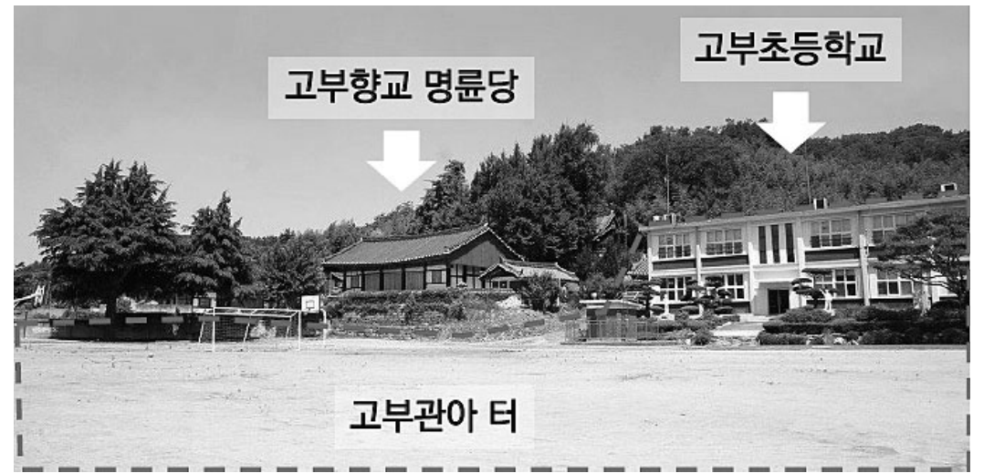
동학농민혁명의 첫 배경이 된 고부관아.