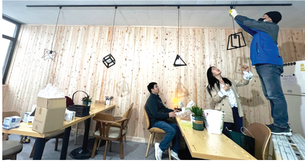
동강대 건축과 학생과 졸업생 등이 동강대 이공관 2층 강의실에 조명을 설치하는 등 새단장하고 있다.

동강대 이공관은 40년이 넘는 오래된 건물인데다 전시 공간이 부족해 모형작품을 복도에 전시해야 했다. 또 건축과는 야간작업이 많아 학생들의 쉼터 공간이 절실한 상황. 이에 동강대 건축과 졸업생들이 바닥과 벽면 리모델링 공사에 필요한 자재를 준비했고 재학생들과 함께 작업했다. 건축과와 협약을 맺은 기업들까지 힘을 보탰다. 학생들과 함께 작업한 이상의 교수는 “학생들이 자신들의 손으로 만든 새로운 공간에 대해 만족감이 높고 특히 건축과 전공자들에게는 산업체를 나가도 현장 경험을 쌓을 수 있어 일석이조의 효과인 셈이다”고 설명했다. 이 같은 공간 탄생은 학생들에게 공유와 기부 등 ESG를 실천하는 계기가 됐다. 이 곳엔 새 물건을 없다. 모든 게 선배들의 기부 물품이다. 한 졸업생은 “직인이 카페를 정리했다”며 매장 내 테이블과 의자를 가져왔고 조명, 사물함 등도 졸업