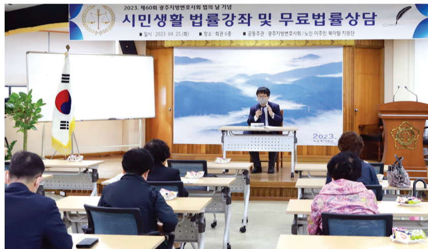
2023. 제60회 광주지방변호사회 법의날 기념 시민생활 법률강좌 및 무료법률상담.

이에 관련 기관들의 협조를 받아 노인, 이주 외국인, 북한이탈주민 등 상대적으로 법률 소외지대에 있는 이웃 50여 명을 초청해 무료 법률상담을 진행