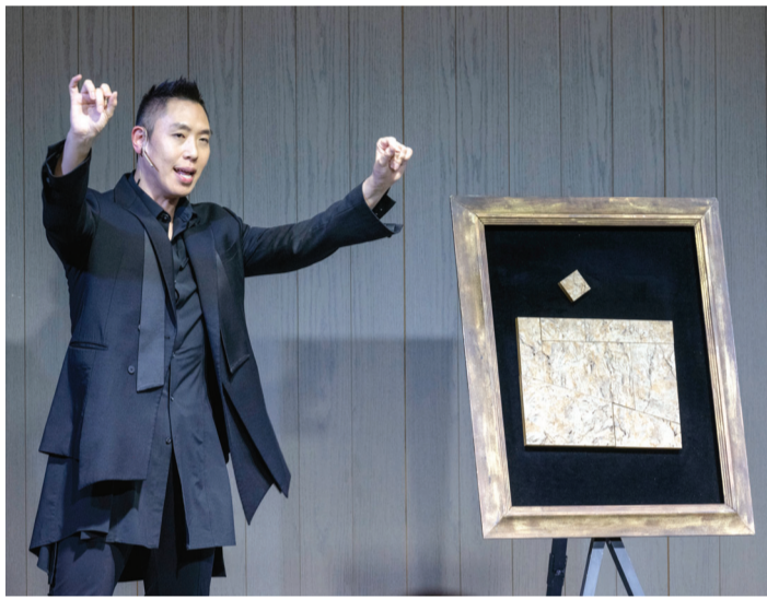
‘세상을 바꾼 4개의 사과’입니다.”

있는 입담에 마술 퍼포먼스를 더한 강연을 진행했다. 한 시간 동안 이어진 강의에는 사과가 등장했다. 마술사의 제스처 하나에 태블릿 기기 속 사과가 무대 위로 소환된 원우의 손 위에 나타나고, 한 입 베어 문 사과를 장갑 안에 넣었다니 어는새 붉은 손수건으로 바뀌는 등 간단한 퍼포먼스 만으로도 환상적인 시간을 만들어갔다. 그는 ‘에덴의 사과’, ‘화가 폴 세잔의 사과’, ‘뉴턴의 사과’, ‘애플사의 사과’ 등 대중들이 익히 알고 있는 네 개의 사과를 제시하며 디지털 가상시대 창의성의 중요성을 이야기했다. “제가 오늘 여러분께 드리는 솔루션은 ‘의심하라’입니다. ‘에덴의 사과’는 금기에 대한 의심, ‘폴 세잔의 사과’는 패러다임에 대한 의심, ‘뉴턴의 사과’는 평범에 대한 의심, 마지막으로 스티브 잡스의 ‘애플 사과’는 한계에 대한 의심이에요. 이것들은