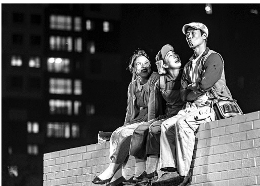
ACC 5월 레퍼토리 연극 '시간을 칠하는 사람'.