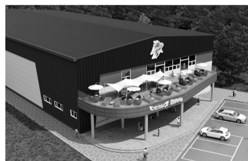
천사히어로즈 기능보강사업 조감도.

정읍시가 직영하는 내장산문화관광 일원 실내 복합놀이시설인 '천사히어로즈'가 어린이날을 앞두고 2일부터 재개장한다. 정읍시는 안전점검과 새로운 시설보강을 마치고 어린이날에 맞춰 천사히어로즈가 개장하며 '에어리얼 로프(Aerial Rope)' 체험코스가 확장되고 '트릭아트존(Trick art zone)'이 체험시설로 새로 추가됐다고 밝혔다. 에어리얼 로프 코스는 천사히어로즈 놀이시설 중 방문객 선호도 조사 1위로 선정된 시설로서 연속적인 공중체험 놀이가 가능하다. 시는 이 시설의 기존 6개 코스를 10개 코스로 늘리고 길이도 60m에서 107m로 연장했다.