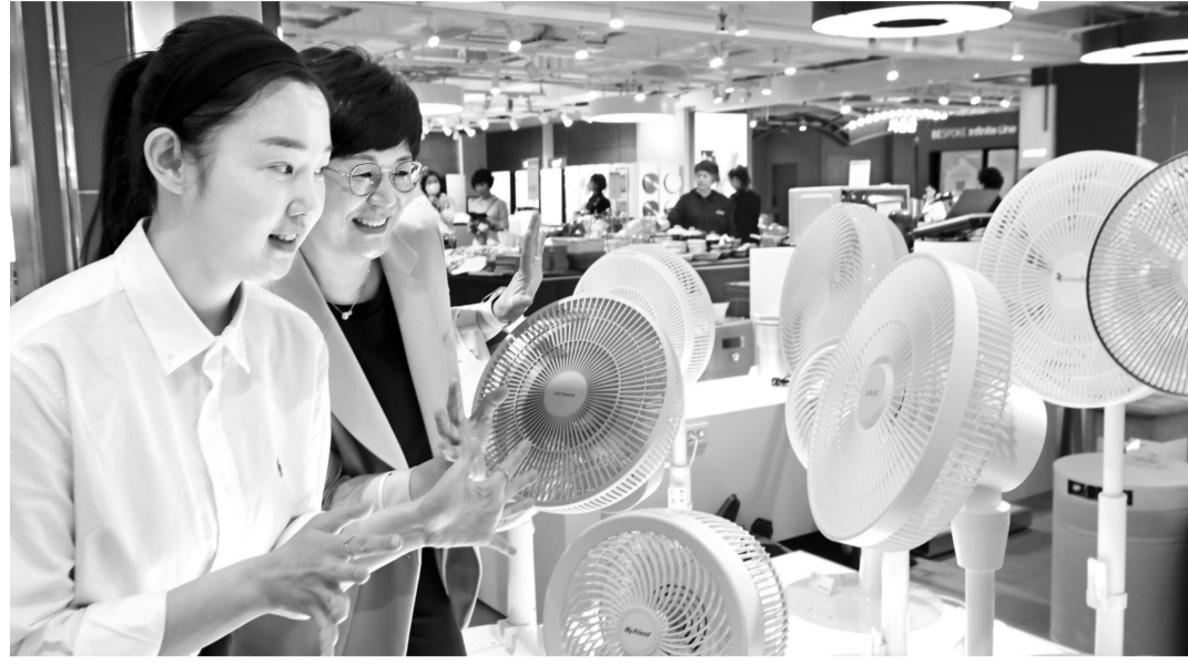
롯데백화점 광주점 직원들이 9층 가전전문관에서 판매 중인 선풍기, 서큘레이터 등 소형 냉방 가전 제품을 선보이고 있다.

한다. 이마트도 행사카드로 삼성전자와 LG전자 에어컨 등 대형가전을 구매하면 최대 50만원의 신세계 상품권 증정하고, 일렉트로맨 12단(BLDC모터) 스탠드 선풍기를 2만원 할인된 가격에 선보인다. 롯데하이마트도 오는 31일까지 삼성전자 무풍걸러리 에어컨 2023년형 행사상품 구매 시 롯데모바일상품권을 제공한다. 아울러 최근 전기료 인상이 잇따르면서 전기 소비가 적은 냉방가전 수요도 증가한 것으로 나타나 유통업체가 관련 상품 구매시 다양한 혜택을 제공한다. 이날 광주지역 이마트에 따르면 지난 5월1일부터 15일까지 전년 대비 창문형 에어컨은 81.4%, 써큘레이터는 14.9%의 매출 신장을 기록했다. 창문형 에어컨은 일반 에어컨보다 전기료 절감에 효과적이라고 입소문을 타면서 판매량이 급증했고,