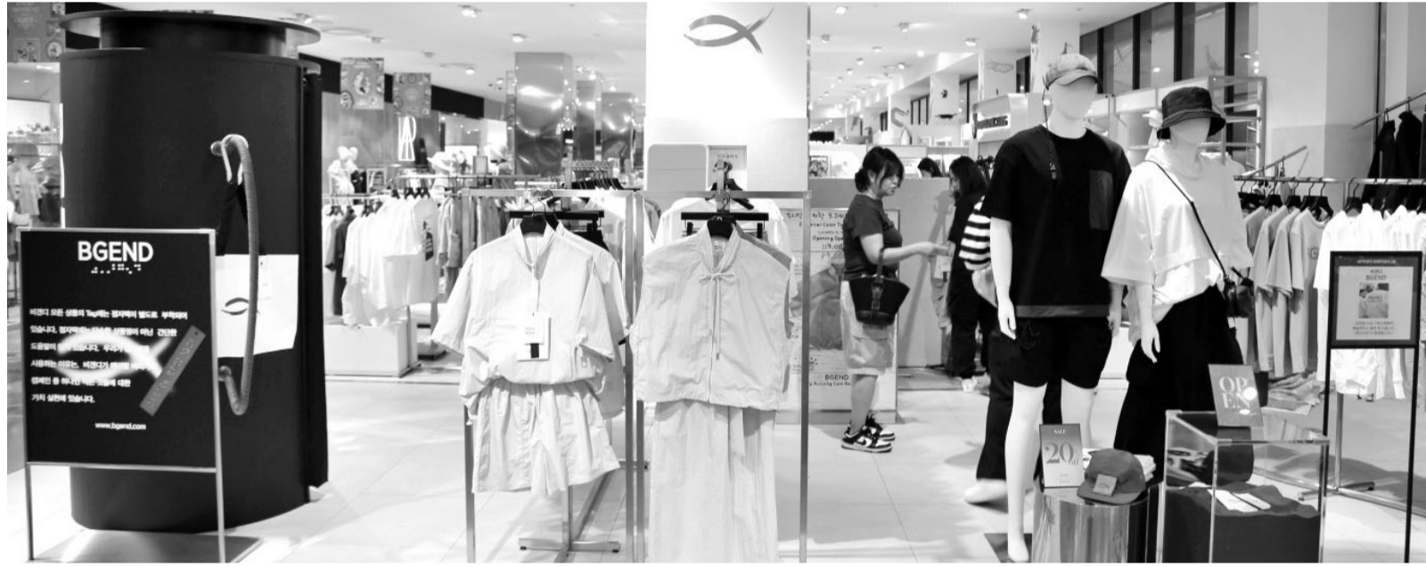
스트리트 감성으로 MZ 유혹 (주)광주신세계는 신관 지하 1층에 MZ세대를 겨냥한 스트리트 감성의 아웃도어 브랜드인 ‘비겐디(BGEND)’를 신규 오픈했다고 17일 밝혔다. 비겐디는 ‘비겐 뒤’라는 한글 의미를 내포하고 있다. 스트리트 캐주얼 룩과 아웃도어 룩을 기반으로 일반적인 개념의 아웃도어 브랜드와 다른 스타일을 제안한다. 비겐디는 오는 21일까지 신규 오픈 기념으로 20% 할인(일부 품목 제외)행사를 진행한다.

한다. 홈플러스는 ‘전기료 걱정 없는 하하하(夏夏夏) 냉방가전 페스티벌’을 열고 여름 필수 아이템을 다양한 혜택과 함께 선보인다. 홈플러스는 이달 들어 에어컨 매출이 증가한데 이어 에어컨과 함께 틀면 전기요금 부담을 낮추면서 냉방 효과를 높일 수 있는 선풍기·서큘레이터 등 인기도 높아질 것으로 분석하고 있다. 특히 전기료 급등으로 생활물가가 높아지면서 고객 부담을 낮출 수 있는 고효율·가성비 가전을 합리적인 가격에 내놨다. 홈플러스는 에너지소비효율 등급이 뛰어난 고효율 에어컨 대표 상품으로 ‘삼성 홈멀티 에어컨’과 ‘LG 2in1 에어컨’을 준비했다. 해당 상품은 신한·삼성카드 결제 시 10% 추가 할인 혜택도 제공한다. 또 대형 냉방기기 가동으로 전기요금이 부담스러운 1~2인 가구에 적합한 창문형 에어컨·선풍기 등도 다양한 혜택을 제공한다. 5월 한 달 간 ‘삼성 창문형 에어컨’ 구매 시 5만원에 상당하는 설치비를 무상 지원한다. 특히 ‘보국 BLDC 선풍기’는 50% 할인한다. /김민석 기자 mskim@kwangju.co.kr