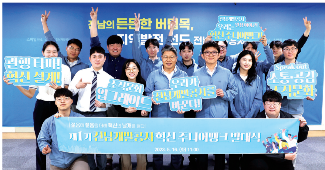
전남개발공사가 지난 16일 공사 내 입사 3년차 이내 MZ세대 직원 14명으로 구성된 ‘제1기 혁신 주니어뱅크 발대식’을 가졌다. ‘혁신 주니어뱅크’는 MZ세대의 시각을 공사 경영에 반영하기 위해 지난 2019년부터 운영되고 있는 주니어뱅크의 역할과 기능을 대폭 강화해 새롭게 조직됐다.