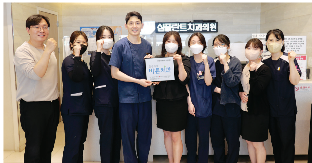
강진 심플란트치과가 대한적십자사 대표 나눔 확산 프로그램 ‘쓰쓰이가 바른병원’ 캠페인에 동참했다. 심플란트치과 원장은 “환자분들에 받은 사랑을 돌려드리고자 캠페인에 동참하게 되었다”며 “앞으로도 지역 사회 환원을 통해 더불어 사는 사회를 만들고 싶다”고 말했다.