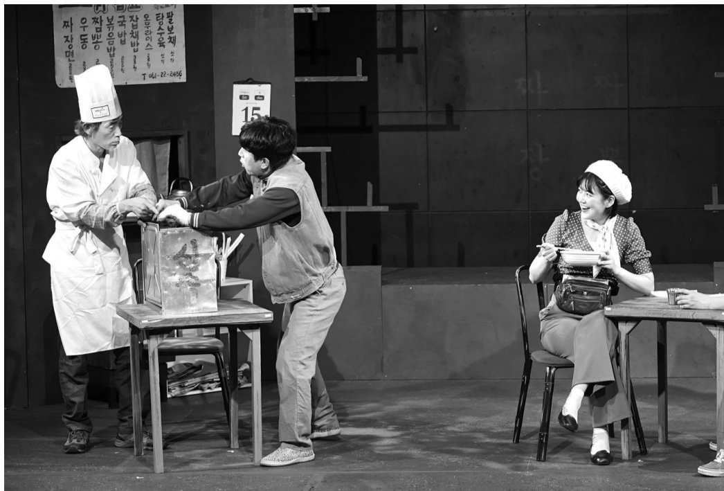
지난해 펼쳐졌던 연극 '고백' 공연의 한 장면.

현재 중소기업 사장인 이정하는 오랜만에 전우 회 동지의 책 소식이 탐탁지 않다. 연극배우인 딸이 공연을 제작하기 위해 광주에 현장답사를 다녀온다는 소식을 들었던 터다. 만호반점 사장 강만호는 매일 꿈을 꾸며 혼란의 날을 보내고 있다. 만호반점 식구들은 80년 5월 당시 즐거운 한때를 보내고 오는 길에 광주에 투입된 계엄군을 맞닥뜨린다.