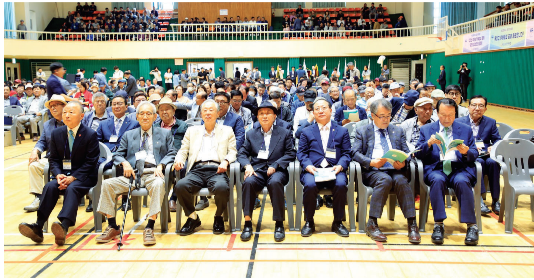
목사고 개교 100주년 기념식 행사가 지역 주요 기관장과 전국의 졸업생 동문 및 재학생 등 500여 명이 참석한 가운데 지난 21일 교내 인동관에서 열렸다.