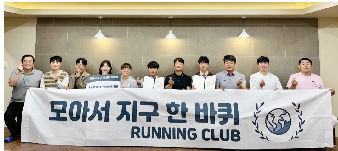
광주석산고등학교가 최근 교사들이 마련한 장학금을 지급했다. 석산고는 15명의 재직 교사들로 이뤄진 운동 동호회 ‘모아서 지구 한 바퀴’를 통해 2019년부터 장학금을 지급해 왔다.