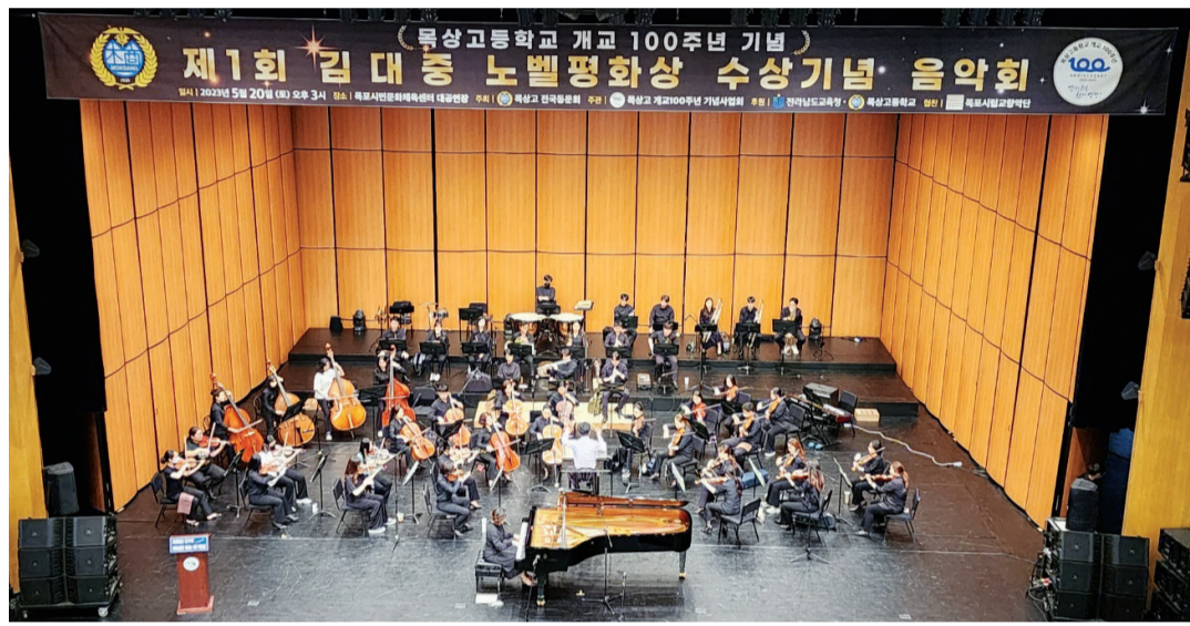
20일 목포시민문화체육센터 대공연장에서 열린 제1회 김대중 노벨평화상 수상 기념 음악회.