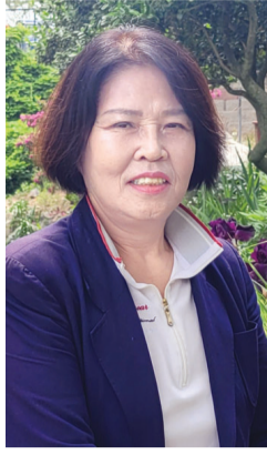
가보지 못했습니다. 타운하우스 등을 짓는다면 땅을 팔라는 이야기도 많이 들었어요. 하지만 녹지를 훼손하고 싶지 않았고, 더 열심히 심고 가꾸었습니다.”

“제 손을 거치지 않은 꽃과 나무가 거의 없지요. 사계절 물을 주고 가꾸야해서 제대로 나들이 한번