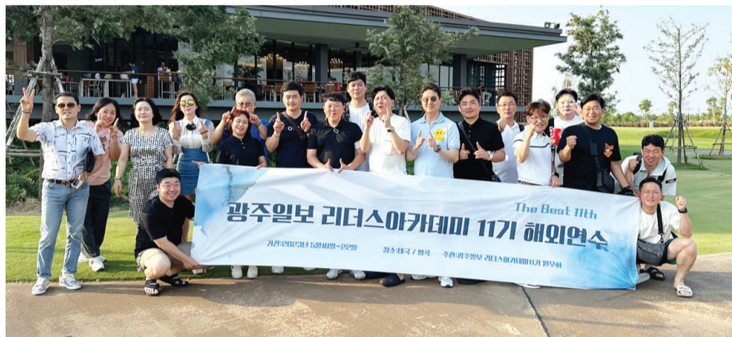
2023 광주일보 리더스 아카데미 11기 하계 연수 프로그램이 지난 18일부터 22일까지 5일간 태국 방콕 일원에서 진행됐다. 태국을 찾은 원우들이 타이CC를 배경으로 기념촬영을 하고 있다.

광주일보 리더스아카데미는 다양한 분야에서 활약하고 있는 국내 최고의 전문가들을 초빙, 수준 높은 강의와 토론을 통해 국가와 지역사회 주