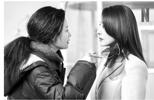
넷플릭스 오리지널 드라마 '퀸메이커'.