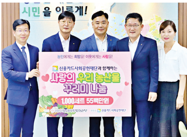
김 바란다”며 “앞으로도 나눔문화 확산을 위해 최선을 다하겠다”고 말했다.