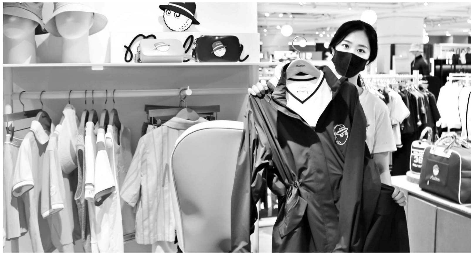
“골프 레인코트 만나보세요” 광주신세계 직원이 골프웨어 브랜드 ‘말본’의 레인코트를 선보이고 있다. 말본은 브랜드 고유의 유니크한 색감과 실루엣, 로고 플레이로 골퍼들 사이에서 큰 인기를 끌고 있다. 말본은 여름철 대표 상품인 레인코트를 69만9000원에 판매 중이다.

이’를 기념해 주요 식품 가격을 할인 판매한다고 밝혔다. 우선 11일까지 ‘국민안심달걀 10구·15구’를 한정 수량으로 반값에 판다. 세븐일레븐 자체 브랜드(PB) ‘만쿠만쿠 치킨’도 특정 카드로 결제하면 50% 할인해준다. 또 7~11일 생수 ‘풀무원워터루틴’을 100만개 한정으로 100원에 내놓는다. 이 밖에 수박, 복숭아 등 계절 과일과 간편식 삼계탕, 팔방수, 과자, 음료, 즉석밥, 캔커피, 햄 등 다양한 상품을 최대 50% 할인된 가격에 만나볼 수 있다. 통계청에 따르면 6월 광주와 전남지역 소비자물가지수는 전년 동월 대비 2.6%, 2.0%로 21개월 만에 2%대로 내려왔다. 그러나 식료품과 음식 물가는 4-6% 수준으로 여전히 높은 수준이다. /김민석 기자 mskim@kwangju.co.kr