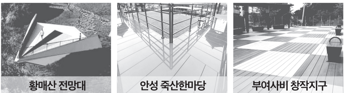
항매산 전망대 안성 죽산한미당 부여사비 창작지구