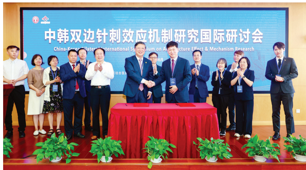
동신대학교 경혈침치료ICT융합연구사업단이 최근 중국 상해중의약대학교 부속 악양중서의결합병원(이하 상해악양병원)과 ‘학술 및 연구 협력 업무협약’을 체결했다.