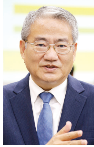
유생 서상철이 의병을 일으켰고(갑오의병), 9월에 동학농민군이 침탈된 국권을 수호하기 위해 2차로 봉기하게 된 것이다.

표와 8명의 집행위원 체제로 운영된다. 또 전봉준 장군 기념사업회와 광주 동학농민혁명 기념사업회 등 전국 50개 동학·시민단체들이 참여하고 있다. 서훈국민연대는 광주 지방보훈청 등 전국에서 2차 동학 참여자의 독립유공자 서훈을 촉구하는 릴레이 피켓시위를 벌였으며, 전국 119개소에 서훈 촉구 플래카드를 게시했다.