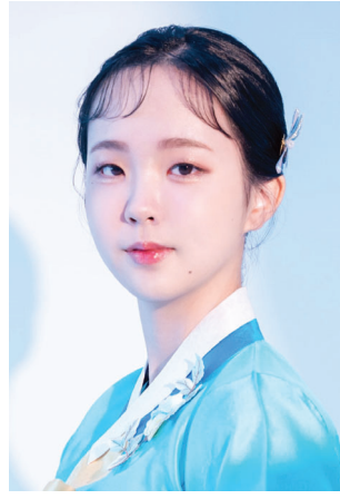
정했다는 게 나양 설명이다.

가야금을 본격적으로 배워볼 생각에 국립전통예술고로 진로를 결정한 뒤 입시준비 과정에서 나양을 눈여겨본 악기자 사장님은 선뜻 1500만원짜리 가야금 2대를 지원해줬다고 한다. 국립전통예술고는 60여 년 전 국악인들이 직접 만든 국악예술학교