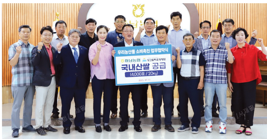
하남농협(박상욱 조합장)은 최근 상그릴라 요양병원(정순부 이사장)과 우리농산물 소비촉진을 위한 업무협약을 체결하고 쌀 4000포를 공급하기로 했다.