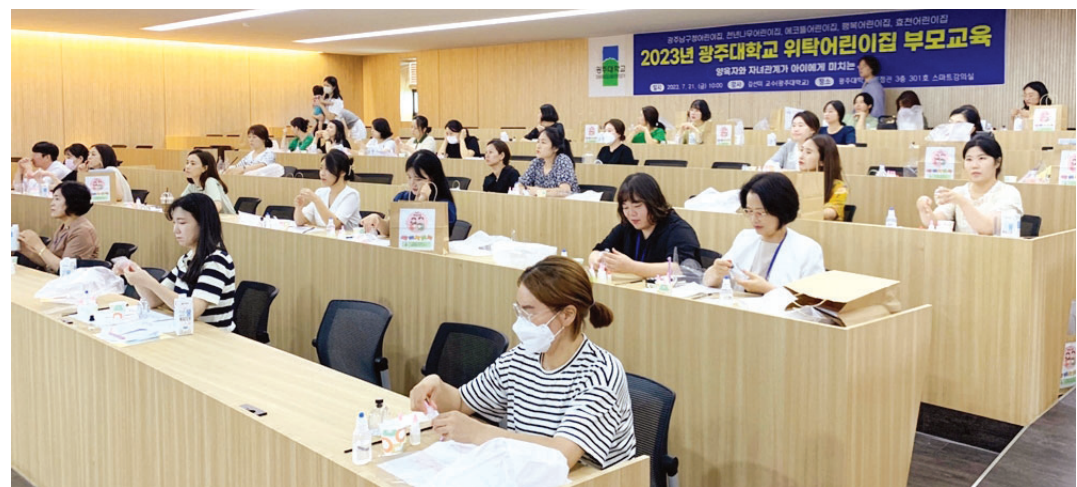
광주대학교(총장 김동진)가 위탁 운영 중인 광주시 남구 5개 어린이집이 공동 주최하는 부모교육이 지난 21일 오전 광주대 행정관 3층 스마트강의실에서 열렸다.