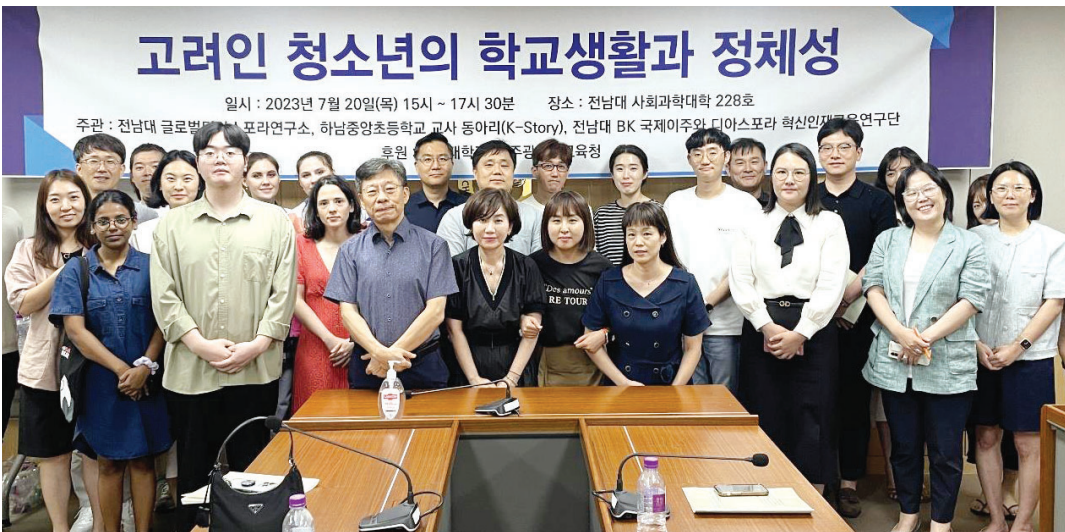
전남대 글로벌디아스포라연구소(소장 김경학)는 지난 20일 '고려인 청소년의 학교생활과 정체성'을 주제로 학술회의를 열었다.