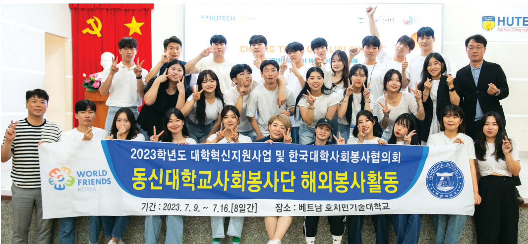
동신대학교 사회봉사단은 지난 9일부터 16일까지 8일 동안 베트남 호치민기술대학교에서 2023년 하계 해외봉사 활동을 진행했다. 3년 만에 재개된 베트남 해외봉사에는 동신대 이주희 총장 등 교직원 5명, 재학생 25명이 참여했다.