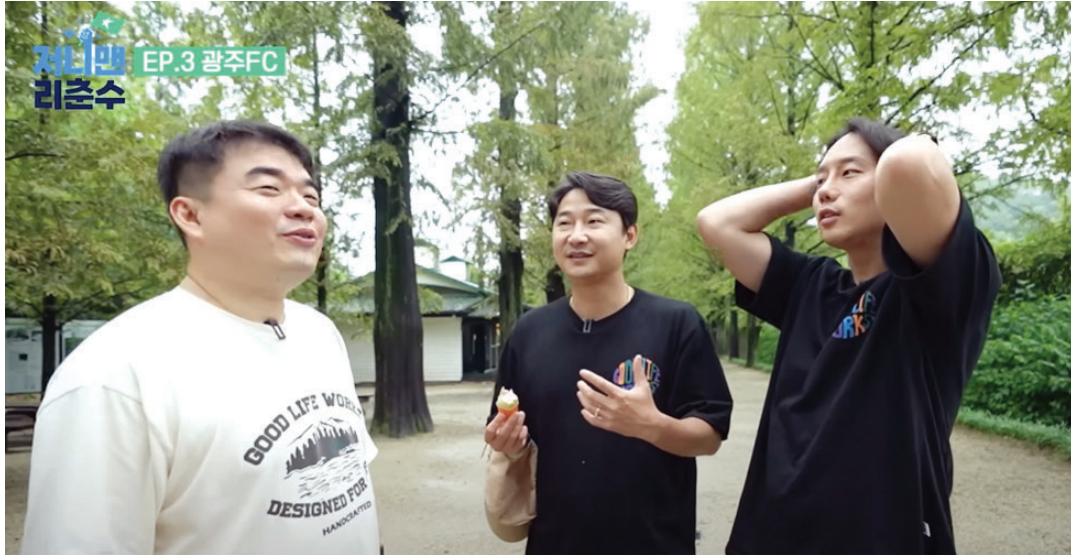
국가대표 축구선수 출신 방송인 이천수(가운데)씨가 '남도 따라가는 여행 미션투어'에서 담양 메타세쿼이아길·메타프로방스 등을 찾아 자연속에서 휴식을 즐기고 있다. <유튜브 채널 '리춘수' 영상 캡처>

영상에는 여행하면 빼놓을 수 없는 다양한 '떡방'도 등장한다. 속을 든든하게 채워주는 나주곰방부터 담양의 특산물 맛을 넣어 만든 찹쌀 도너츠, 광주의 푸근한 정을 느낄 수 있는 20첩 백반까지 남도의 맛을 즐기는 모습도 담겼다. 이 씨는 "어디 가나 맛깔나는 음식과 정을 느낄 수 있어서 여행 내내 만족했다"며 "축구, 야구, 배구 등 다양한 프로스포츠를 즐길 수 있고 자연과 문화가 깃들여 있는 남도맛기행 지역에 많이 방문했으면 좋겠다"고 말했다.