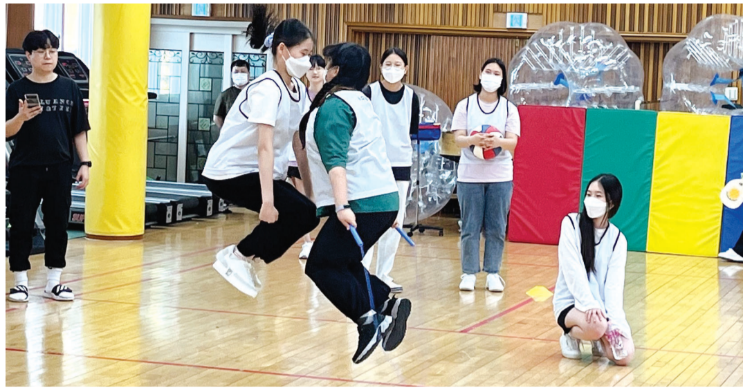
지속적인 교류를 진행하고 있는 광주여고와 시각장애 특수학교 광주세광학교 학생들. 사진은 세광학교에서 열린 체육 행사 모습.