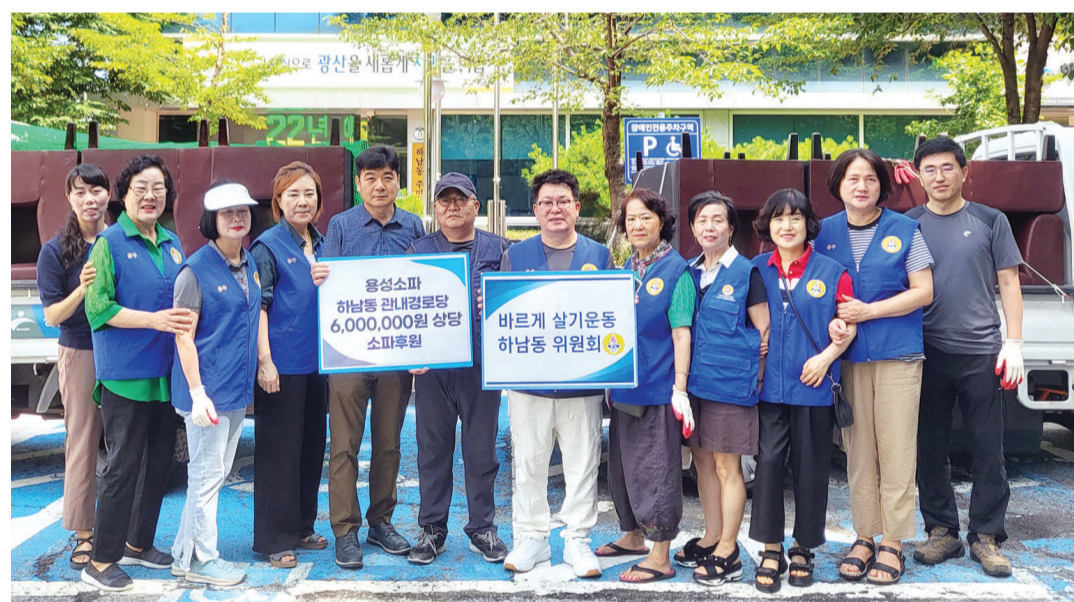
광주시 광산구 신가동의 소파 생산업체인 용성소파(대표 이용주)가 26일 하남동 경로당 12개소에 소파(3인용) 12개(600만 원 상당)를 전달했다.