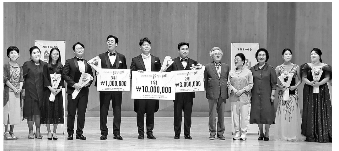
지난 21일 성료한 '솔림성악콩쿠르'의 시상식 모습.