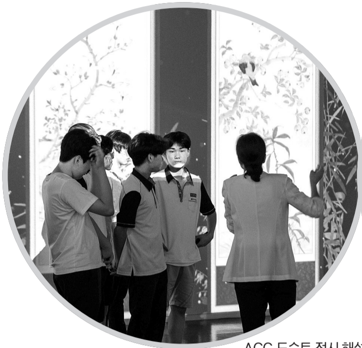
ACC 도슨트 전시 해설(왼쪽)과 어린이 청소년 관련 프로그램 교육 장면.