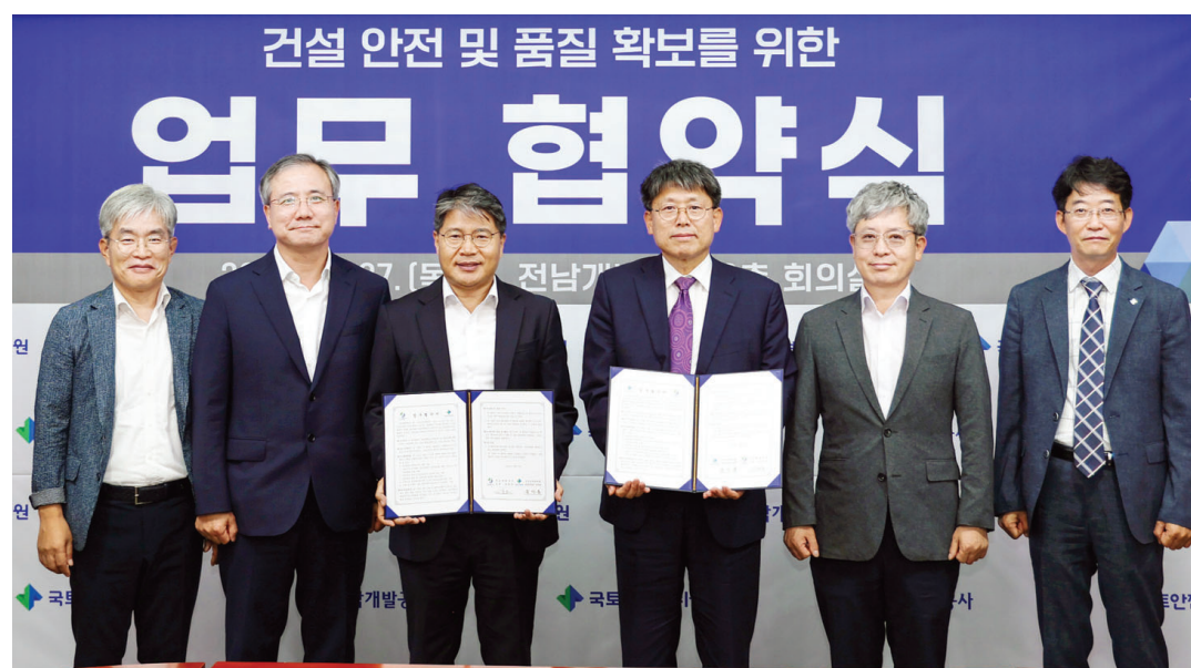
전남개발공사는 지난 27일 국토안전관리원(KALIS)과 건설현장 안전 확보 및 안전한 건설문화 정착을 위한 업무협약을 체결했다.